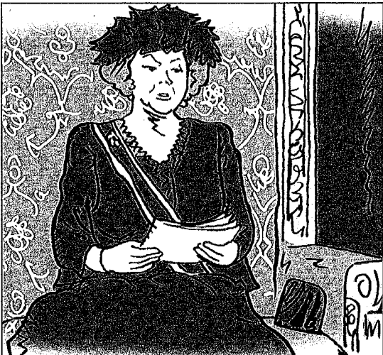
De koningin leest de troonrede voor. Daarmee opent ze de vergadering van de Staten-Generaal.

Filips de Goede stierf in 1467. Daarna werd het Bourgondische Rijk nog groter. In 1500 werd Karel V geboren. Hij werd in 1515 Heer der Nederlanden.