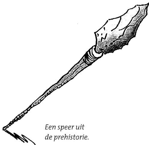
Een speer uit de prehistorie.

De tijd waarin de mensen nog niet konden lezen en schrijven, noemen we de prehistorie. De prehistorie begint met de steentijd. Hun belangrijkste gereedschap maakten de mensen van vuursteen. Met speren jaagden ze op rendieren. Alles wat ze nodig hadden, kwam van deze dieren. Van de huiden maakten ze kleren, tenten en waterzakken. Van botten en geweien maakten ze gereedschap. Jagers die in Zuid-Europa leefden, woonden ook wel in grotten. Heel langzaam werd het klimaat warmer. Daardoor kwamen er andere planten en dieren. De jagers gingen ook vissen en ze begonnen bessen en noten te verzamelen.