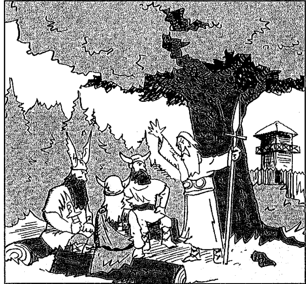
De Germanen kwamen samen op heilige plaatsen in de natuur.

De boeren die hier woonden, noemen we Germanen. Zij geloofden in meerdere goden. Die woonden in het walhalla. De Germanen geloofden dat zij na hun dood ook naar het walhalla gingen. Tenminste, als ze dapper waren geweest. Belangrijke Germanen werden soms begraven met hun boot, paard of wapens. Daaraan konden de goden zien hoe belangrijk ze waren. De Germanen kwamen samen op heilige plaatsen in de natuur. Daar bespraken ze belangrijke zaken en er werden mensen gestraft. De Germanen kenden veel feesten. Met oudjaar werden de wintergeesten weggejaagd met vuren en veel herrie. Een ander feest was het zonnewende-feest, om de terugkeer van de zon te vieren. In plaats daarvan vieren we nu Kerstmis. Onze dagen van de week zijn genoemd naar Germaanse goden.